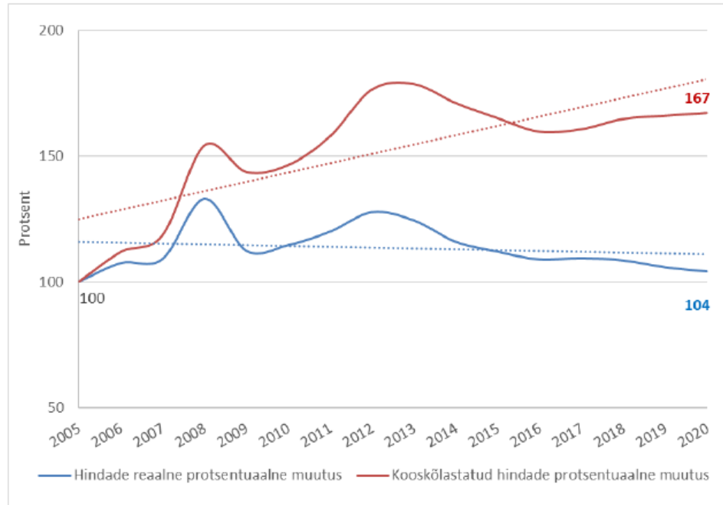
Joonis 8. Kooskõlastatud keskmiste soojuste hindade protsentuaalsed muutused võrrelduna hindade reaalse protsentuaalse muutusega

https://www.konkurentsiamet.ee/sites/default/files/Dokumentide-failid/29.11_regulatsiooni_tulemuste_hindamine.pdf